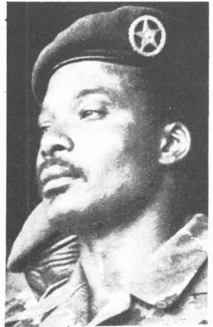
Denis Sassou Nguesso

D'altra banda, la dependència alimentària del país respecte l'exterior ha augmentat. El 1981 el Congo importava articles alimentaris per un valor de 18.000 milions de francs, el 1982 per 36.000 milions i al 1984 per 46.000 mi-