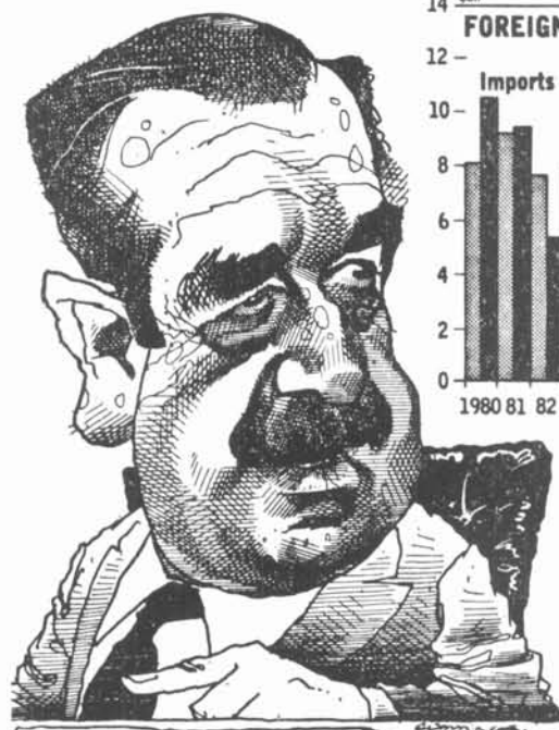
RAUL ALFONSIN Financial Times

Els termes nuclears del protocol, mantenen que l'Argentina i el Brasil cooperaran estretament per tal de prevenir o pal·liar els danys que poguessin esdevenir d'un accident nuclear. Un altre protocol preveu la creació d'un centre bilateral de biotecnologia.