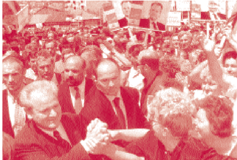
Slobodan Milosevic a Prístina, en plena campanya electoral el juny de 1997.

Els combats entre els pocs milers de combatents albanokosovars i els aproximadament 40.000 policies i militars serbis provoquen l'èxode de més de 200.000 persones. A la tardor, quan les principals carreteres i ciutats de Kosovo ja són una altra vegada sota control serbi, la població civil es converteix en víctima de la "neteja ètnica", mitjançant l'assassinat de petits grups d'albano-