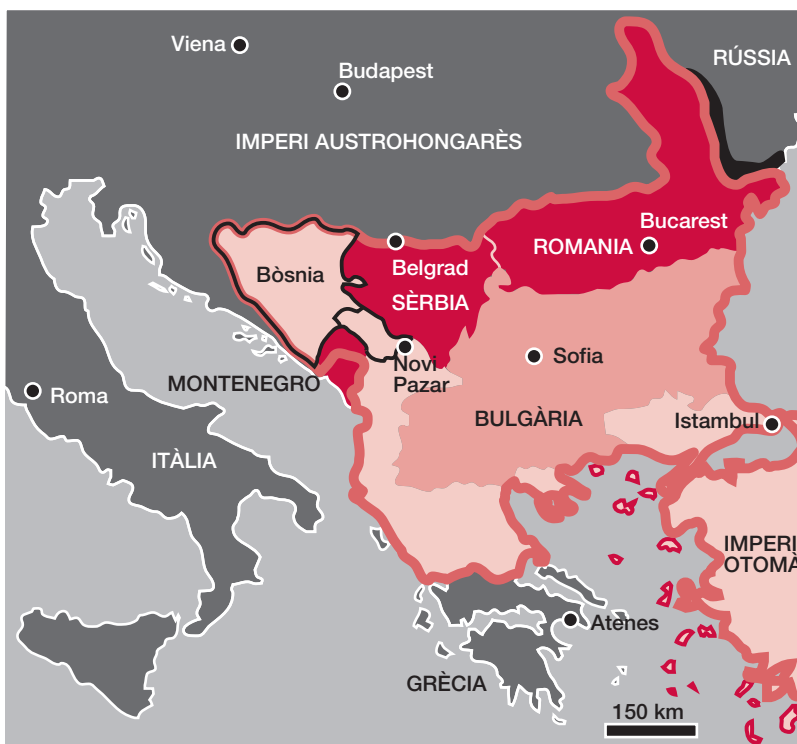
El desmembrament de l'Imperi Otomà

Durant el segle XIX la península balcànica passa d'estar dominada per dos grans imperis multiètnics –Àustria-Hongria i l'Imperi Otomà– a ser un mosaic de petits estats nacionals que tendeixen cap a l'homogeneïtat ètnica. El 1815, quan el Congrés de Viena, derrotat