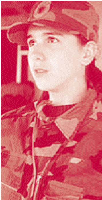
Voluntària de l'EAK