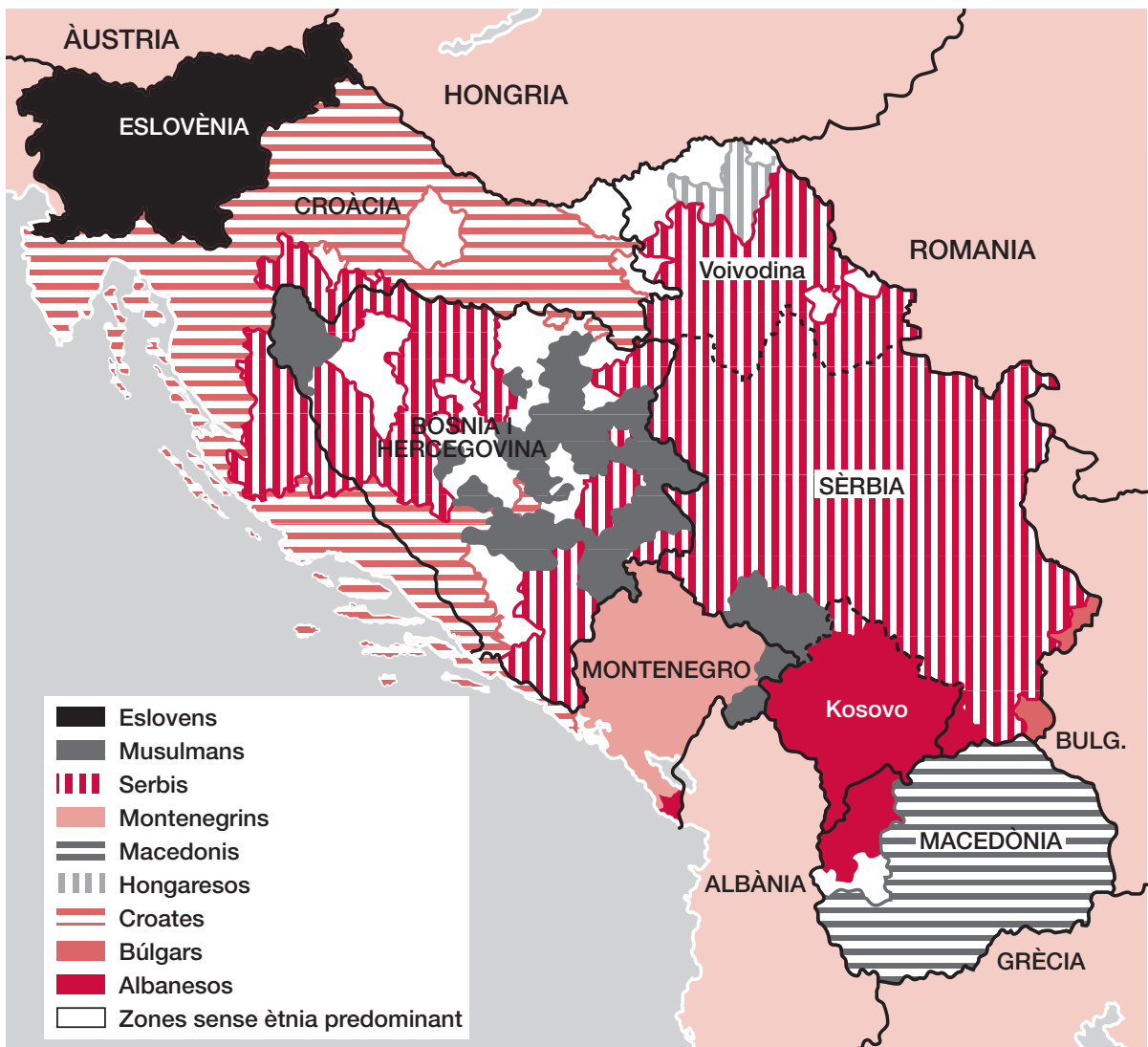
Mapa ètnic de l'antiga Iugoslàvia

http://www.serbia-info.com/news/kosovo/index.html