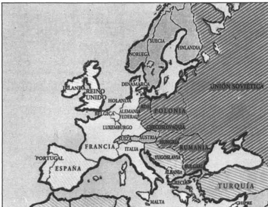
L'Europa dels blocs (1945-1989)

1975.- Acta Final de la CSCE a Hèlsinki.