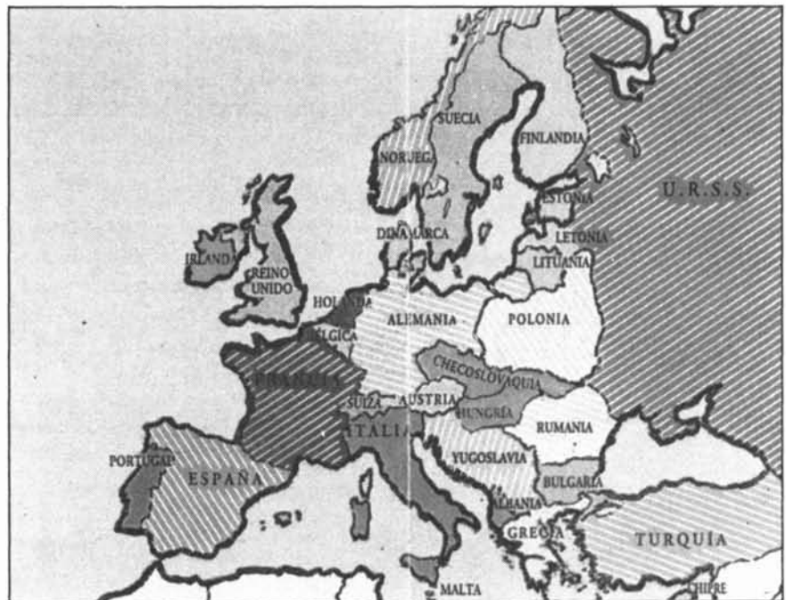
L'Europa de les nacions (1919)

Fundació de la Kominform : oficina d'informació per a coordinar les activitats dels partits comunistes sota el control soviètic.