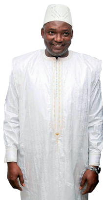
Adama Barrow Presidente electo de Gambia

Barrow es el símbolo de una tendencia más amplia en el África Subsahariana, caracterizada por una sociedad civil cada vez más movilizadora, que presiona a sus líderes políticos para evitar su eternización en el poder y que reclama mayor transparencia política y rendición de cuentas. El sorprendente resultado de las elecciones gambianas demuestra que el cambio político impulsado desde abajo es posible y que líderes como el saliente Yahya Jammeh (22 años en el poder) ya no tienen carta blanca para hacer y deshacer.