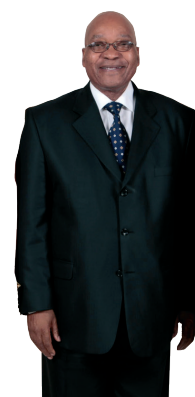
Jacob Zuma ¿Fin de una etapa política en Sudáfrica?

En la última cumbre de la UA, el presidente keniano, Uhuru Kenyatta, instó a los países africanos a abandonar el Tribunal por considerarlo un "instrumento de dominio occidental" que sólo procesa a líderes o figuras africanas. Este hecho pone sobre todo de relieve la debilidad de la hegemonía occidental en un contexto de creciente multipolaridad que los líderes políticos africanos están aprovechando. Burundi, Sudáfrica y Gambia han notificado a NNUU su voluntad de abandonar el Estatuto de Roma que establece el TPI, una retirada que se hará efectiva en 2017, una posibilidad también apuntada por Kenya y Namibia.