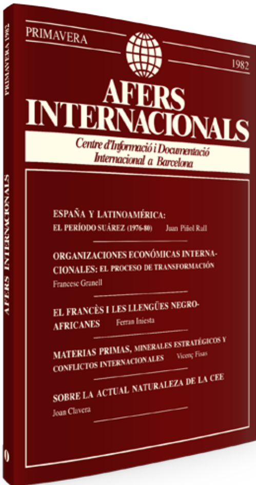
Revista Afers Internacionals núm. 0