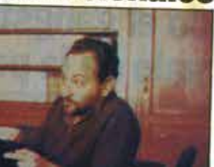
Toda vez en el Agencament, (Foto: Xarxa Valls)

El Centre d'Informació i Documentació Internacional de Barcelona ha iniciat un projecte de treball que té com a objectiu principal la recerca i la difusió de la informació internacional.