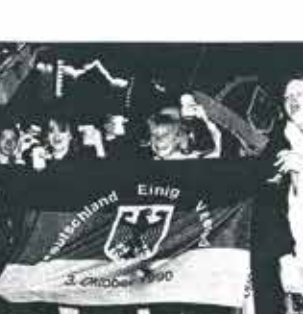
3 de octubre de 1990, día de la unificación alemana.

Este es el nuevo anuario del CIDOB, que aparece cada año. Contiene información sobre los países más pequeños del mundo, documentos y mapas.