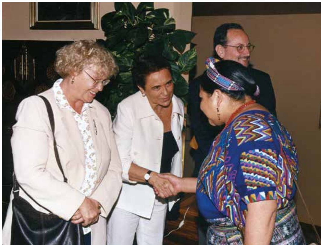
Rigoberta Menchu visita Barcelona: Dolors Renau, Francesca Munt, Josep Ribera i Rigoberta Menchú, 1994

Veient la crisi actual de refugiats arreu del món, i en què el nostre país hi té un paper tan poc encomiable, comprenem la vigència d'iniciatives com la d'en Josep Ribera en fundar ACSAR i la necessitat de mantenir aquell esperit d'anar més enllà del marc establert, del més fàcil i immediat i cercar noves vies d'ajuda sempre per endavant del marc reduït i estret que se'ns proposa. Potser mirant la situació actual és fàcil caure en el desànim o el pessimisme, certament hi ha raons. Però mirant endarrere, gairebé 40 anys des que va començar aquesta acció, recordem què teníem: dictadures arreu d'Amèrica Llatina, guerres a Centreamèrica, Europa dividida en dos blocs, els conflictes de la descolonització a l'Àfrica. Algunes d'aquestes situacions han estat superades i, sens dubte, les propostes, accions i iniciatives d'en Josep Ribera hi han contribuït, introduint aquestes temàtiques internacionals al nostre país, creant consciència solidària.