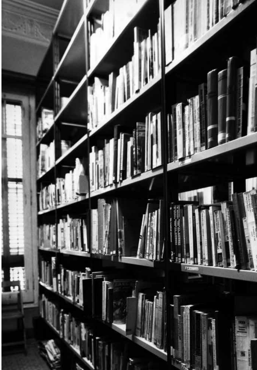
Centre de documentació del carrer Roger de Llúria