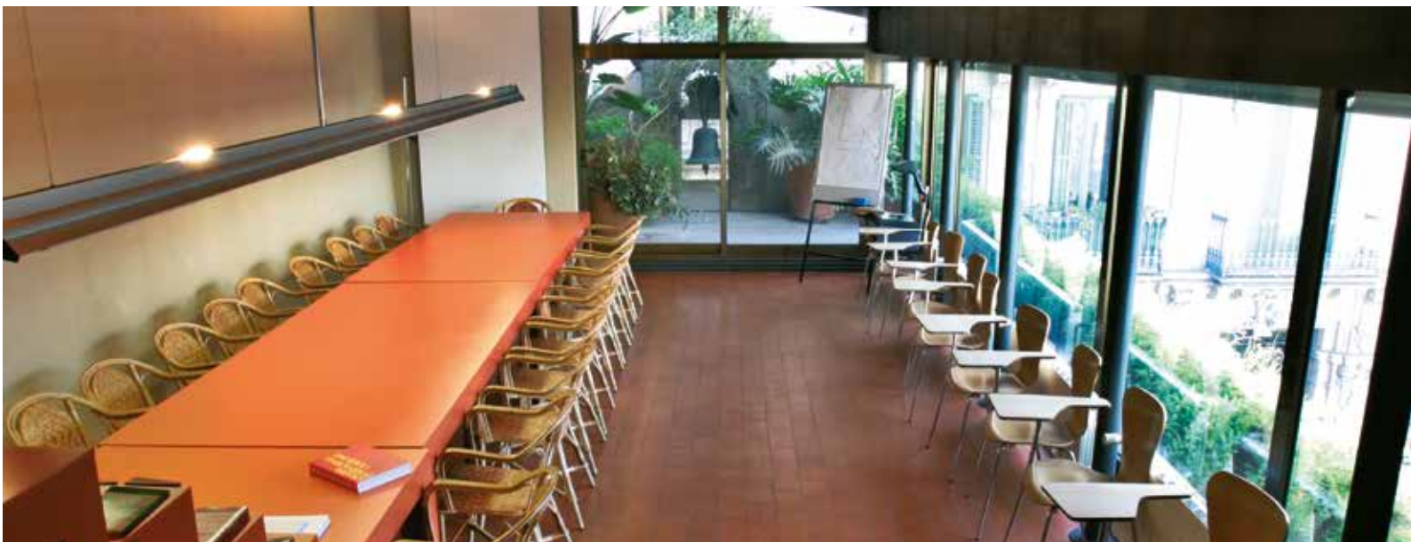
Capella dels Infants Orfes, locals de Cidob

En Pep Ribera, cal dir-ho, va ser una d'aquestes persones especials que honoren amb lletres grans la condició de ciutadà.