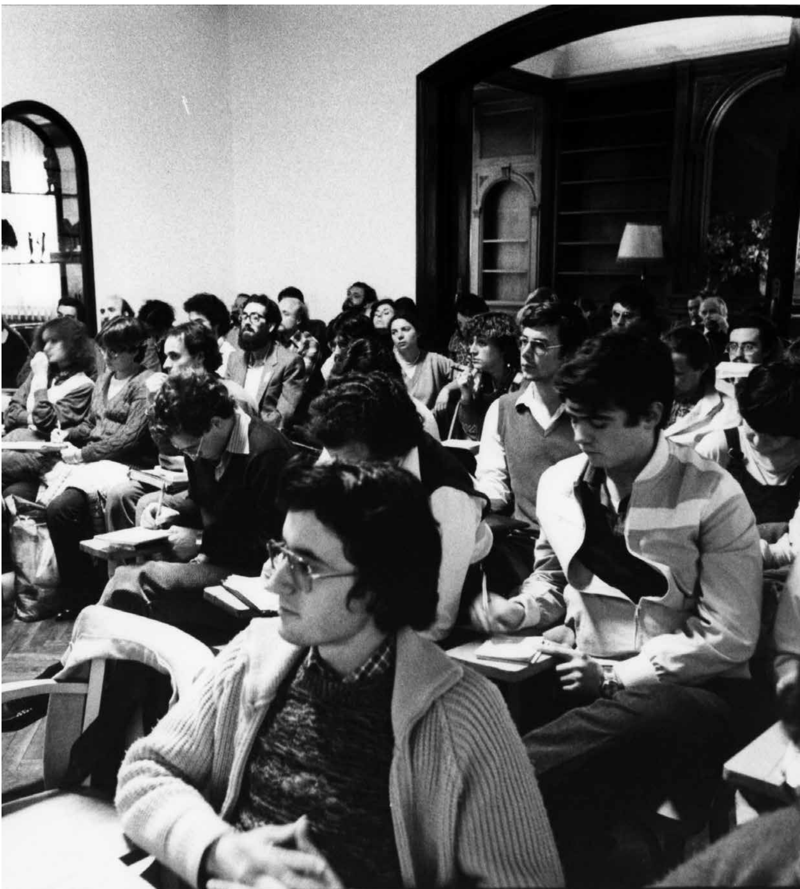
Cursos especialitzats a la seu del carrer Roger de LLúria