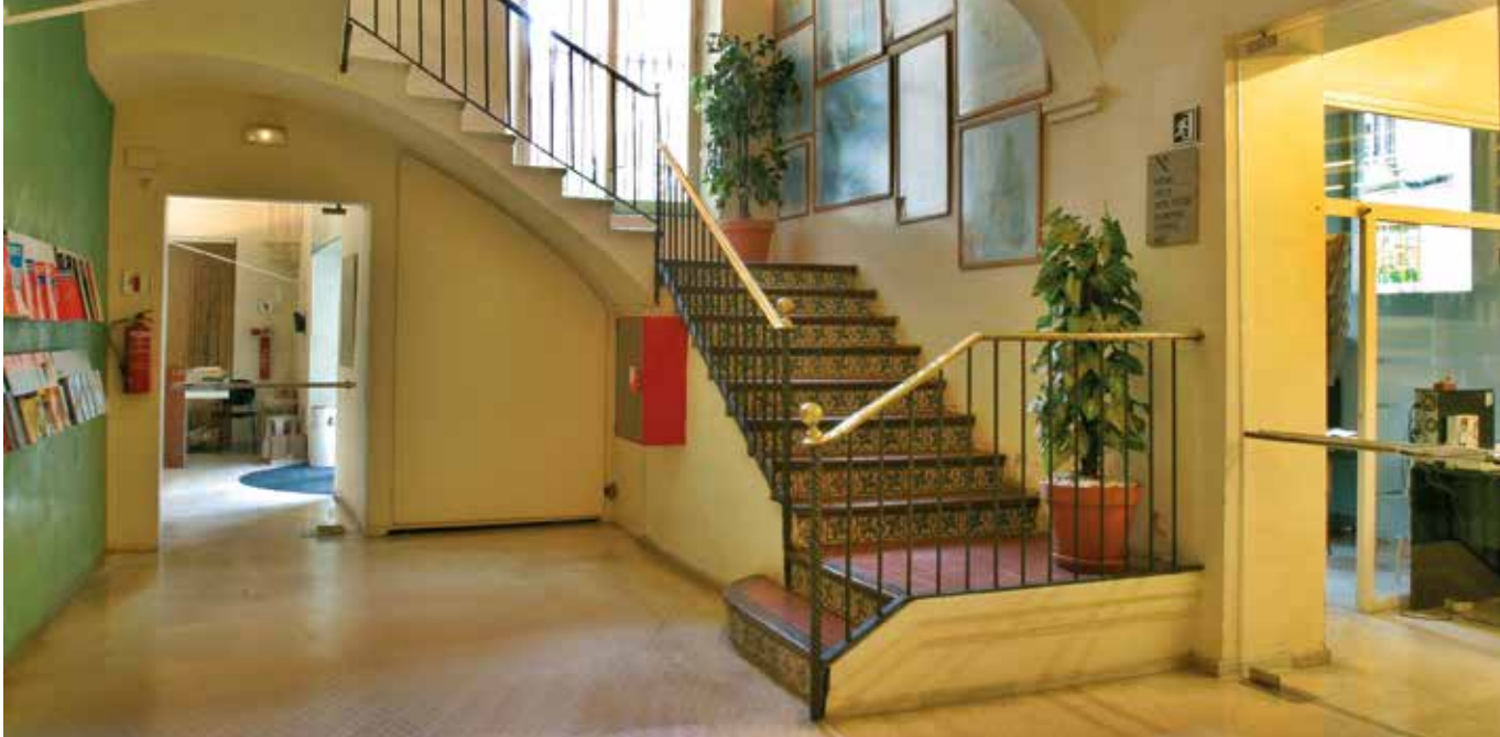
Hall de l'edifici de Guillem d'Aquitània