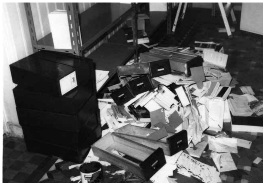
Entrada de Fuerza Nueva i el PENS als locals d'Agermanament, 1971