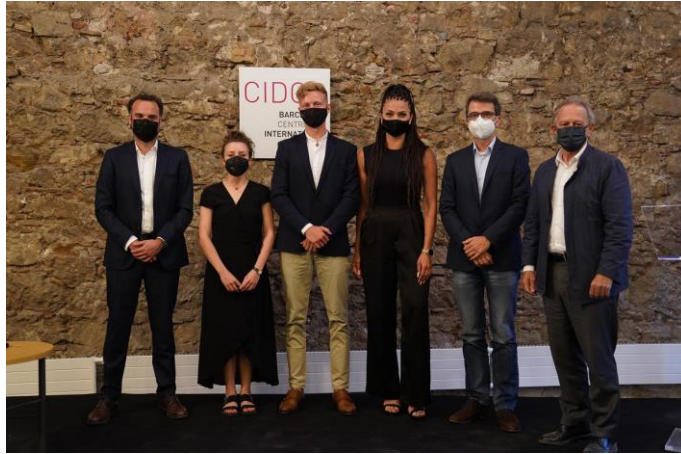
Diálogos CIDOB-Fundación Banc Sabadell, 18 de junio de 2021, CIDOB

>> Galería de imágenes: Diálogos CIDOB-Fundación Banc Sabadell