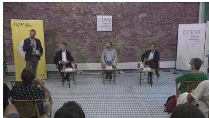
¿Se debe dialogar con terroristas? Lecciones de Afganistán y otros conflictos, 30 de septiembre de 2021, CIDOB

>> Video: ¿Se debe dialogar con terroristas? Lecciones de Afganistán y otros conflictos