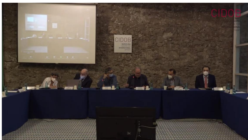
Comercio Internacional y Estrategias de Resiliencia Económica: Una mirada desde Barcelona

Este seminario, organizado conjuntamente por CIDOB y el Área Metropolitana de Barcelona (AMB), tiene como objetivo ofrecer un mapa de las diferentes estrategias de resiliencia económica en el mundo y su posible impacto sobre el comercio internacional. ¿Es resiliencia sinónimo de proteccionismo? ¿Son necesarias nuevas políticas industriales basadas en subsidios y/o políticas comerciales agresivas? ¿Cómo puede Barcelona y su área de influencia protegerse ante la competición entre los Estados Unidos y China? ¿Cuál está siendo la respuesta de la Unión Europea?