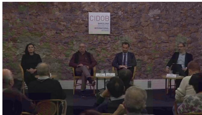
Presente y futuro de Afganistán tras la vuelta de los Talibanes, 17 de noviembre de 2021, CIDOB

>> Video: Presente y futuro de Afganistán tras la vuelta de los Talibanes