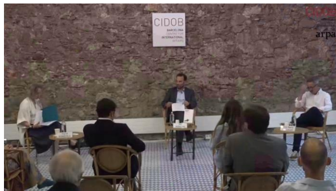
¿Orden o caos? Populismo, humanismo tecnológico y democracia liberal, 17 de junio de 2021, CIDOB

>> Video: ¿Orden o caos? Populismo, humanismo tecnológico y democracia liberal