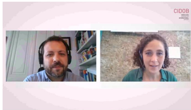
Ceuta: entre la crisis migratoria y la diplomática, 20 de mayo de 2021

>> Video: Ceuta: entre la crisis migratoria y la diplomática