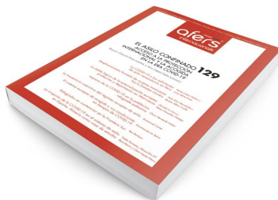
Revista CIDOB d'Afers Internacionals 129

El asilo confinado: acceso a la protección internacional y la acogida en la era COVID-19 Nº129 (diciembre)