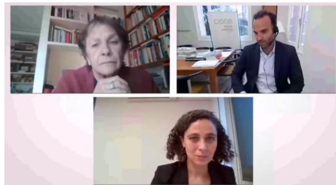
Bielorrusia: las crisis migratorias como herramientas de coerción, 16 de noviembre de 2021

>> Video: Bielorrusia: las crisis migratorias como herramientas de coerción