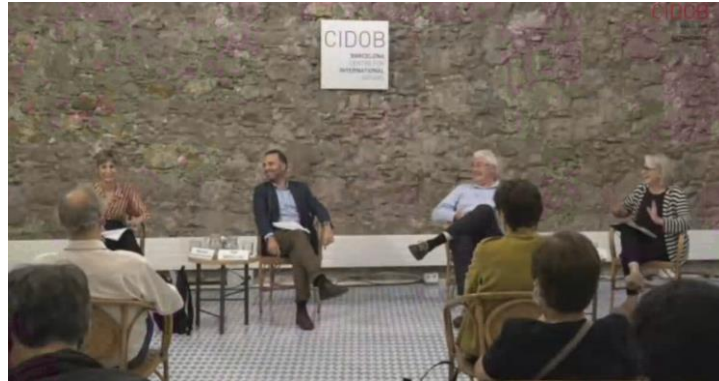
La era post-Merkel: repercusiones para Alemania y la Unión Europea, 29 de septiembre de 2021, CIDOB

>> Video: La era post-Merkel: repercusiones para Alemania y la Unión Europea