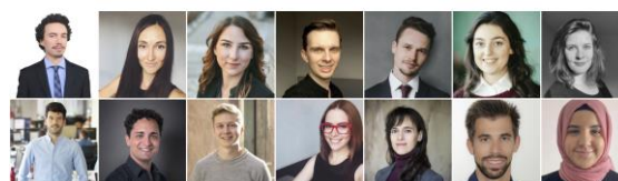
35 under 35 List