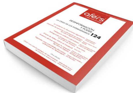
Revista CIDOB d'Afers Internacionals 124

Resurgimiento de la derecha en América Latina: nuevas coaliciones y agendas Nº123 (diciembre)