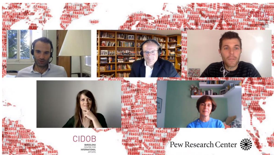
La ONU a los 75: Repensando el multilateralismo, 28 de septiembre