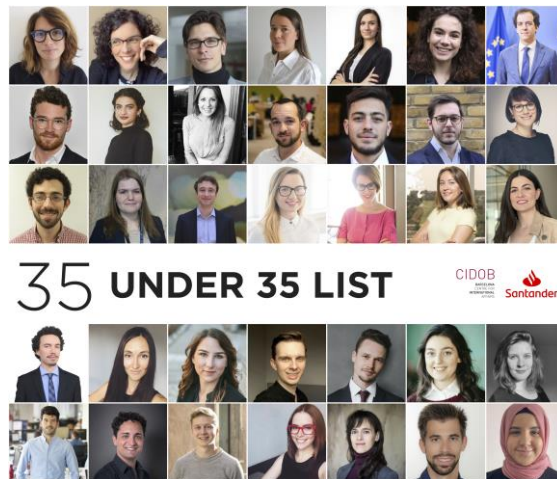
35 under 35 List

The topic of this year’s edition is: Global Techno-politics: Technology, the next global order and the role of the EU . The international liberal order seems today at stake, facing multiple challenges. The technological and digital fields are only two among those affected. Yet, due to their growing importance for the world in the next half century, the matter on how new technologies are incorporated into our social and political realities becomes decisive. What will be the relation between technology and digitalization processes and the global political and economic orders? Would multilateralism, economic openness or democratic governance be sacrificed for the sake of technological revolutions? Will illiberalism hold the upper hand in the digitalisation of the world?