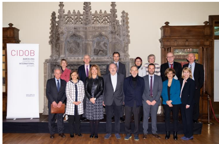
‘A world of two or three? The US, China and the EU in a new global order’ Palau de Pedralbes, 18 de enero de 2020