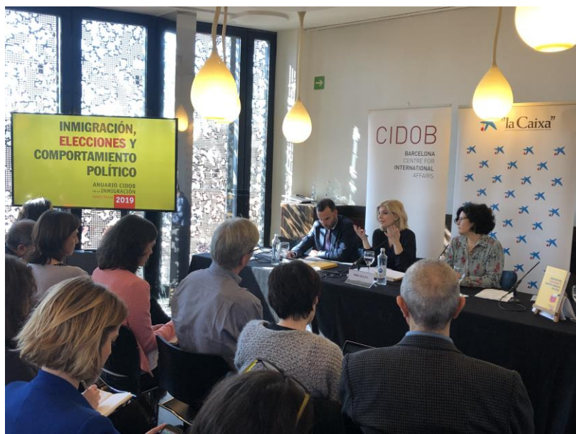
Presentación Anuario CIDOB de la Inmigración, 20 de febrero de 2020, CaixaForum Madrid