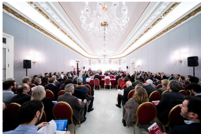
‘A world of two or three? The US, China and the EU in a new global order’ Palau de Pedralbes, 18 de enero de 2020