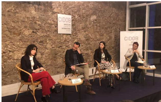
Ciclo "¿Qué pasa en el mundo?" Elecciones USA 2020: la campaña después del Super Tuesday. Sala Maragall, CIDOB. Barcelona, 9 de marzo